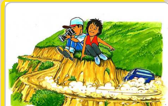
No se acerque a la carretera. Tendrà una mejor visión desde un punto elevado