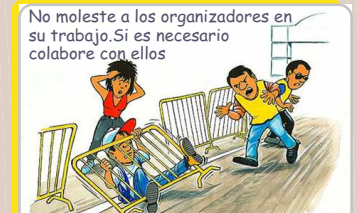
No moleste a los organizadores en su trabajo. Si es necesario colabore con ellos