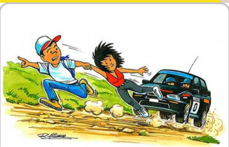
Elija su lugar antes del inicio del tramo