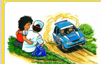
Sitúese en lugares altos y no abandone su lugar antes de pasar el vehículo escoba